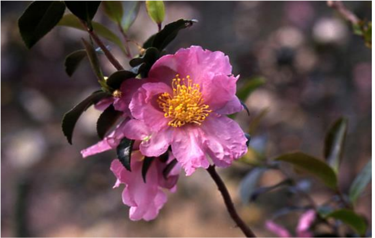
‘七福神’（しちふくじん）