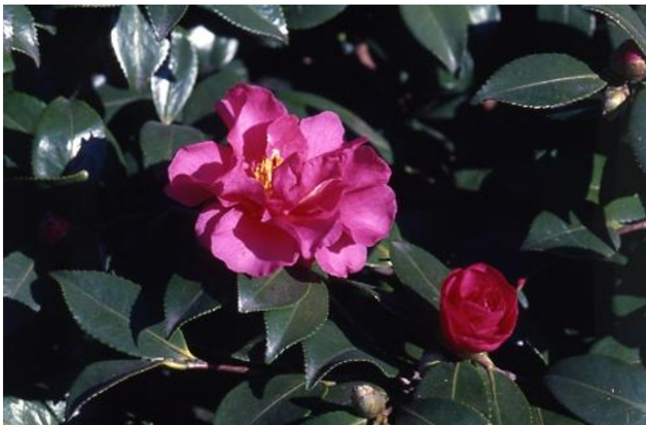
‘獅子頭’（ししがしら）