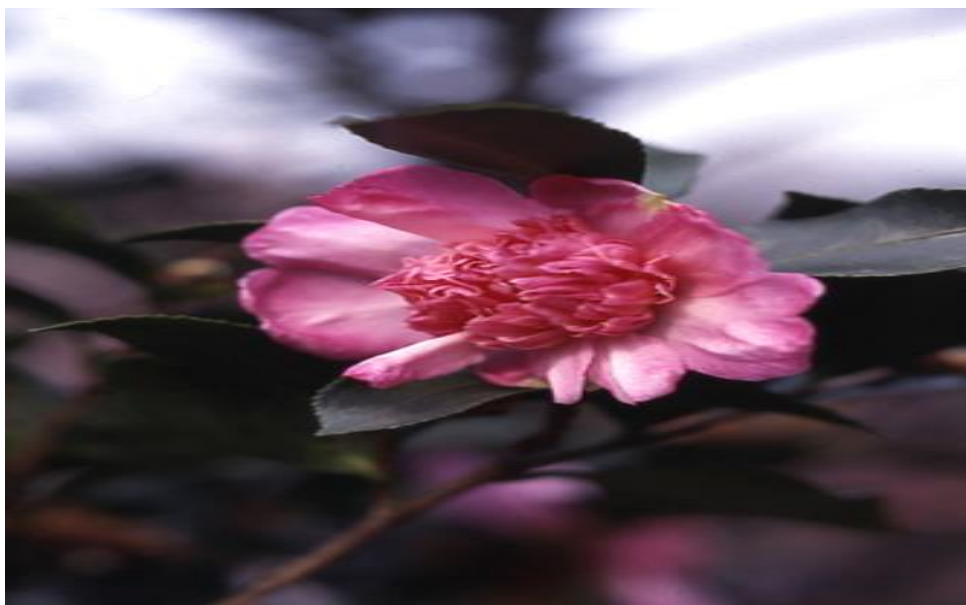
‘丁字車’（ちょうじぐるま）