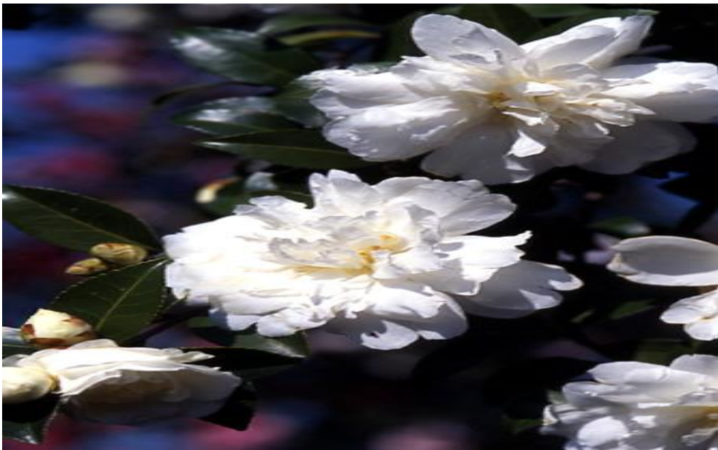
‘富士の峰’（ふじのみね）